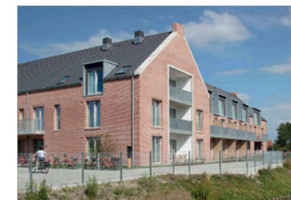
Im Nordseeheilbad Carolinensiel-Harlesiel

Konsequente Designsprache an der Fassade in Carolinensiel oder in der Freifläche: Die Materialgleichheit bei Kantenschutz und Rosten ermöglicht eine einheitliche Optik. An der Küste bestünde durch das Salzwasser eine erhöhte Korrosionsgefahr bei anderen Materialien. Der Werkstoff Kunststoff garantiert einen dauerhaft schönen Anblick.