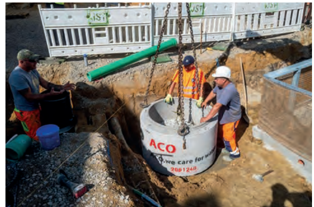
Setzen des Revisionschachtes