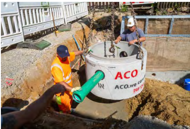
Verbindungsrohr am Revisionschacht