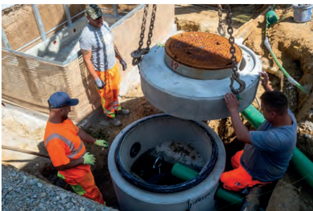
Aufsetzen der Abdeckung auf den Revisionschacht