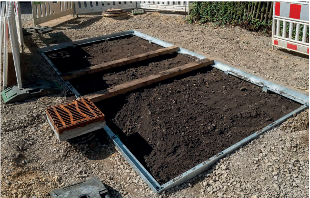
Baumquartier verfüllt mit Substrat und eingesetztem Schwammstadt Straßenablauf