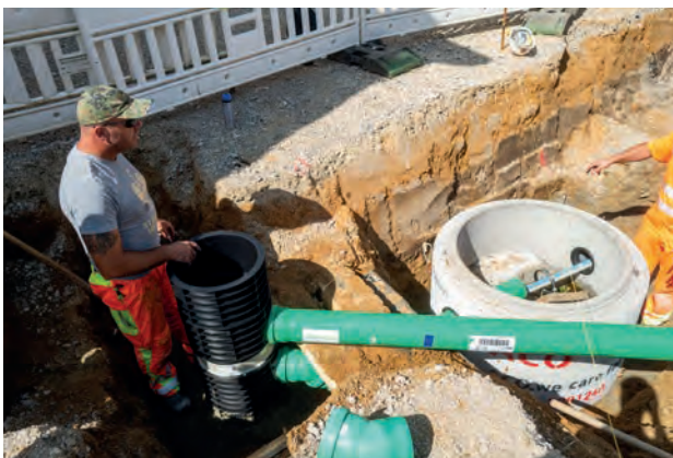
Verbindungsrohr am Schwammstadt Straßenablauf