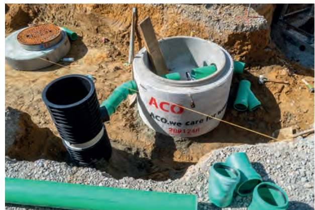
Schwammstadt Straßenablauf verbunden mit dem Revisionschacht