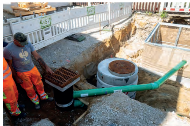
Verbunden: Schwammstadt Straßenablauf mit Bewässerungsleitung zum Baumquartier